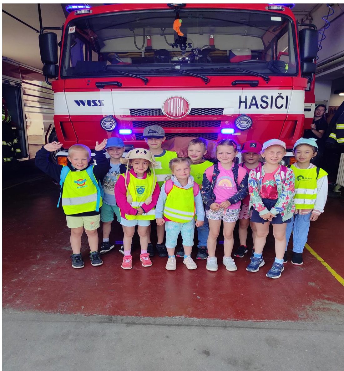
Exkurze u hasičů – MŠ Čtyřlístek

HASIČSKÝ ZÁCHRANNÝ SBOR – exkurze, seznámení s technikou, součást minimálního preventivního programu školy.