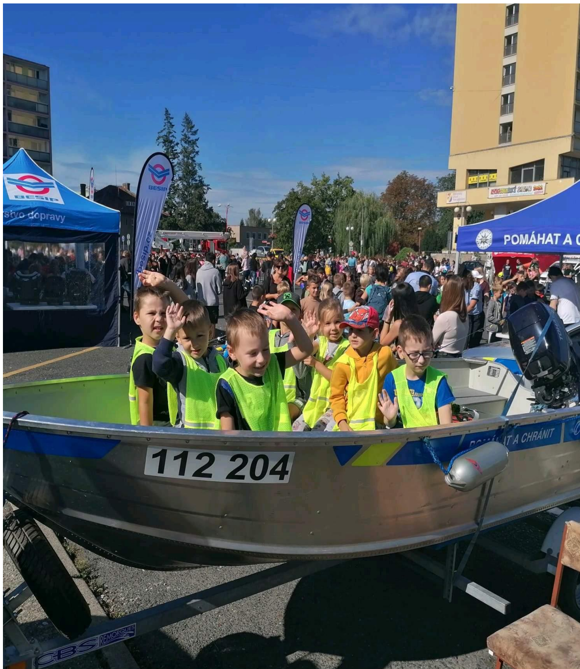
Den bezpečí – MŠ U Rybiček

dovednosti jim pak pomohou řešit problémy. Ve skupině dětí mají opakující se možnost zlepšovat své sociální dovednosti a adekvátní reakce na neúspěch a stres.