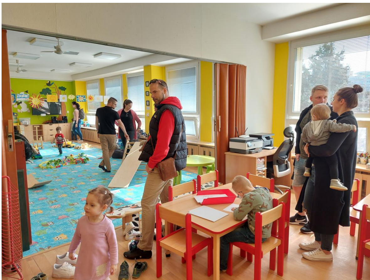
Den otevřených dveří na pracovišti MŠ Písnička