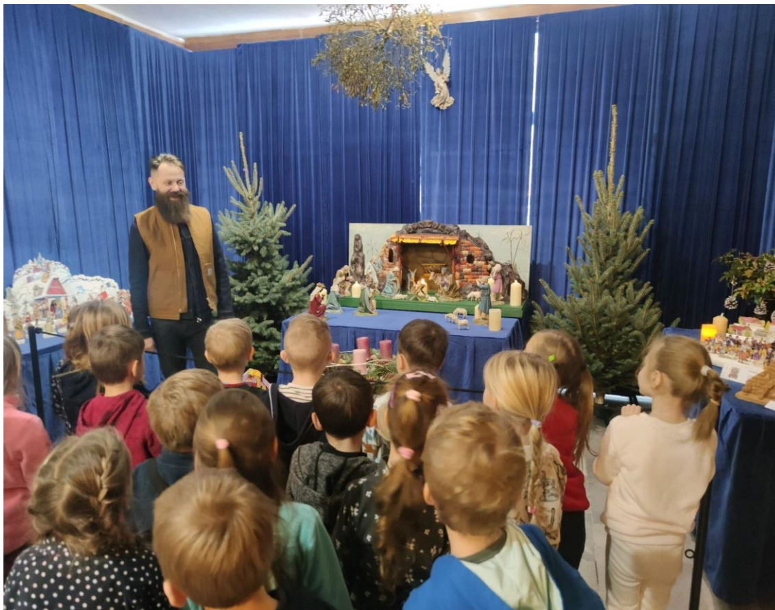
Komentovaná prohlídka Vánoční výstavy – MŠ Písnicka

SPOLEČENSKÝ DŮM NERATOVICE – již druhým rokem úzce spolupracujeme s vedením společenského domu. Tradičně se všechny školy zapojují do Vánoční výstavy, využíváme možnosti komentovaných prohlídek k výstavám i bohaté dramaturgické nabídky představení s doplněním o tvořivé dílny v prostorách knihovny.