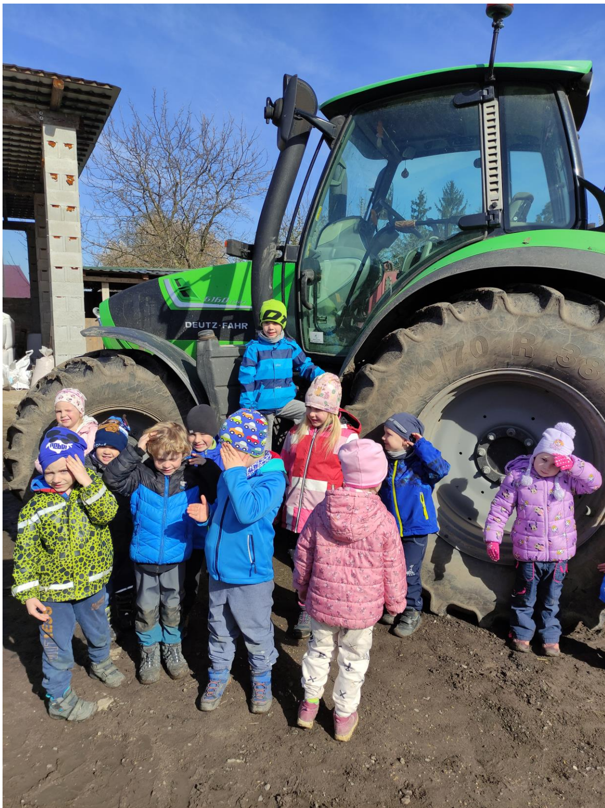
Výlet na farmu do Kozel – MŠ Berušky