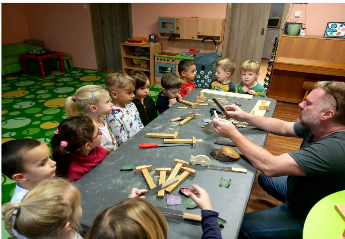
Projekt Dřevíčkování – MŠ Čtyřlístek