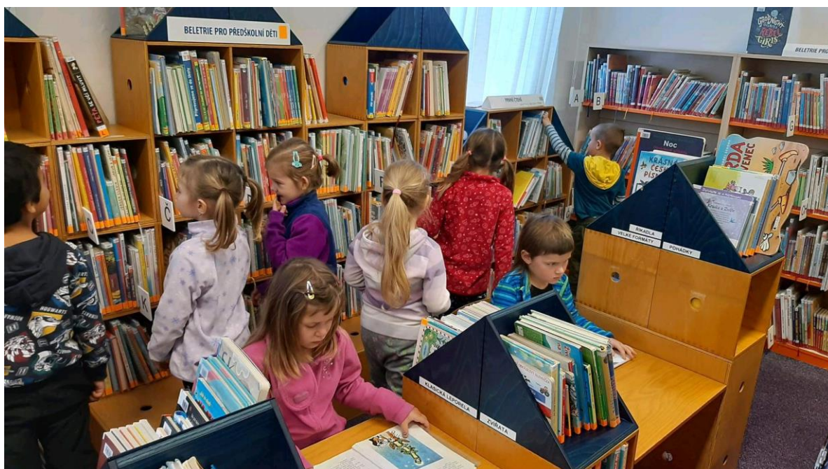
Předčtenářská příprava v knihovně – MŠ Sluníčko

Cíleně se zaměřujeme na rozvoj komunikačních a předčtenářských dovedností dětí. V tomto školním roce byly v říjnu provedeny logopedické depistáže klinickým logopedem u dětí s povinnou předškolní docházkou. Na základě tohoto screeningu je rodičům doporučována návštěvy klinického logopeda. Učitelky s kurzem logopedické asistentky na jednotlivých pracovištích vycházejí z těchto výsledků při sestavování individuálních i skupinových komunikačních chviliek. Cílem je dlouhodobá a systematická podpora správného vývoje řeči dětí.