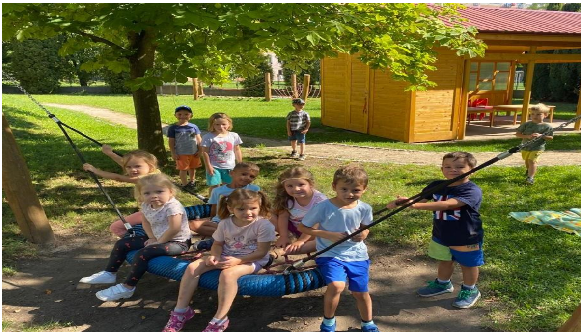
Zrekonstruovaný domeček s venkovní učebnou – MŠ Písnička

Pro zlepšení všech zmíněných podmínek proběhly v tomto školním roce tyto akce – oprava rozvodů vody a směšovačů v suterénu i na některých třídách mateřské školy / dále jen MŠ/ Sluníčko, Písnička, Čtyřlístek. Celkově jsou rozvody vody téměř na všech pracovištích školy v havarijním stavu a je třeba, aby město naplánovalo jejich systematickou výměnu. Sanace sklepních prostor na pracovišti MŠ Berušky, celková výměna osvětlení tříd na MŠ Písnička, výměna trubic, žárovek za úsporné v prostorách chodeb, kanceláří a provozu jídelen na pracovišti ŠJ Zahrádka, na ředitelství školy, MŠ Čtyřlístek, MŠ Berušky. Bezpečnostní systém SAFY – MŠ Kaštánek, MŠ Písnička – otvírání dveří od firmy BD SENSORS, všichni dospělý vstupují do budovy školy v určené časy na biometrický otisk palce. Zevnitř jsou vchody zabezpečeny odchodovým tlačítkem mimo dosah dětí. Kompletní rekonstrukce Ivenkovní učebny / zahradního domečku a pořízení technického zahradního domku na MŠ Písnička, nová šatna pro děti na MŠ Sluníčko. Na MŠ U Rybiček stále probíhá revitalizace zahrady. Na ředitelství školy bylo realizováno zateplení a snížení stropů ve vstupní místnosti a v kanceláři hospodářky školy.