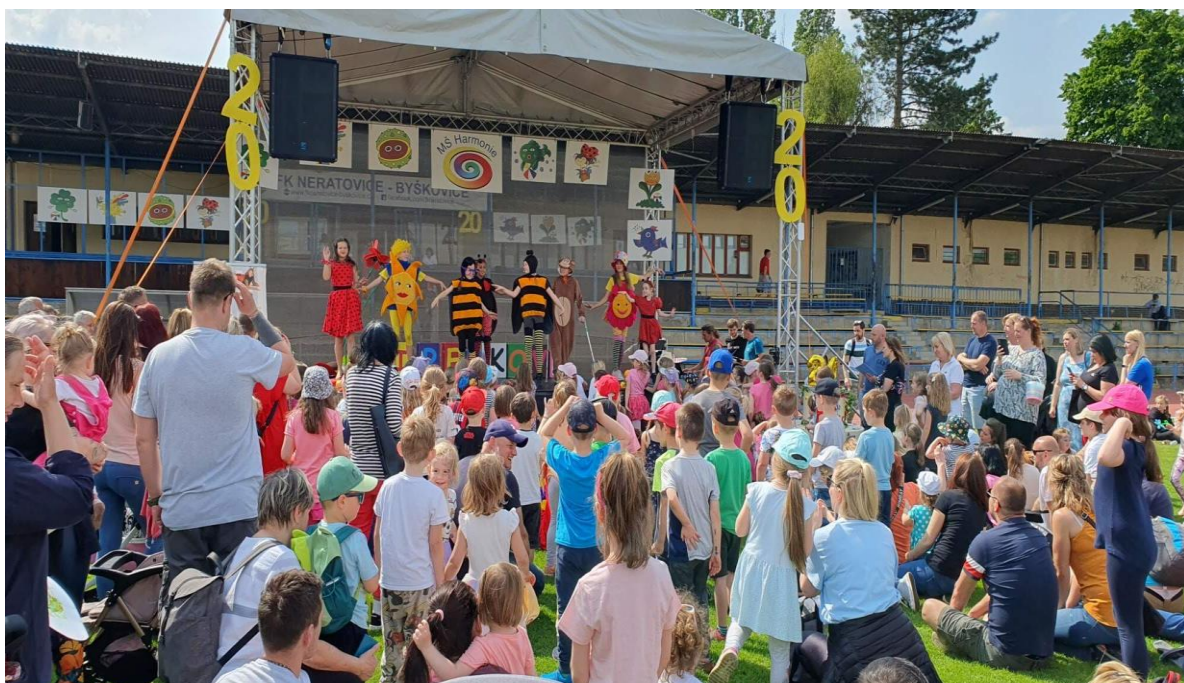
Akce „Harmonie slaví a všichni se baví“