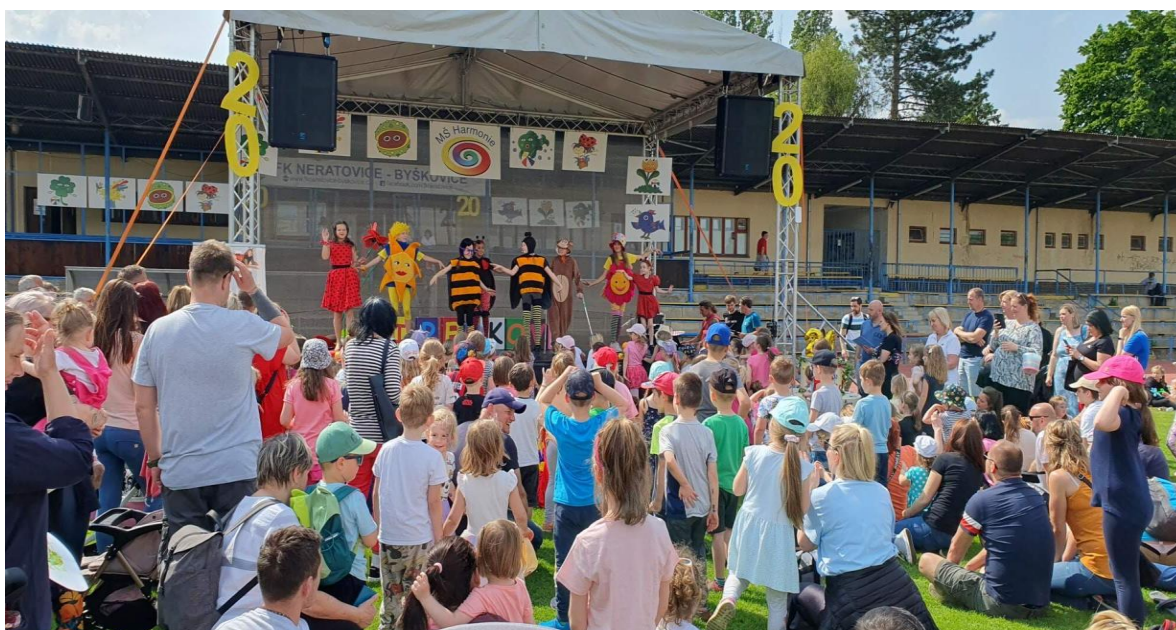
Akce „Harmonie slaví a všichni se baví“ - 20.5.2023