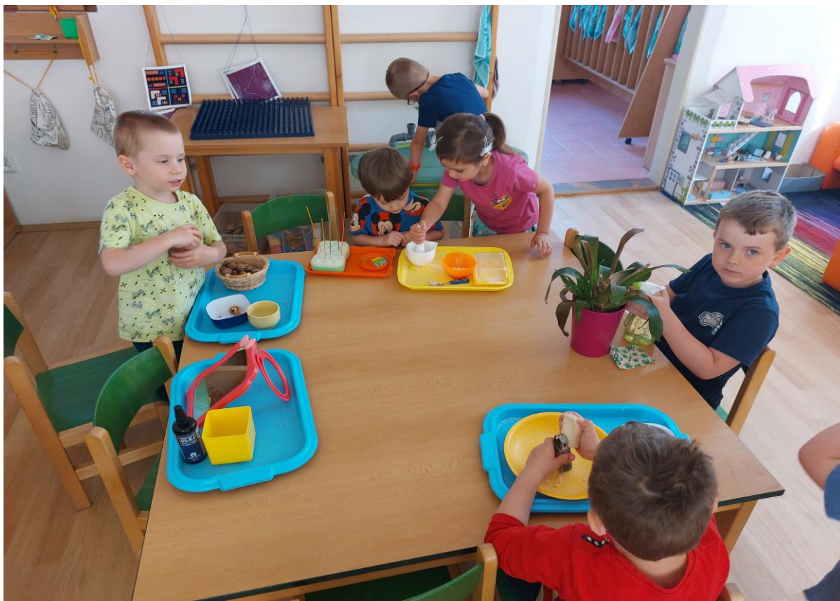
Vzdělávací činnosti dětí – MŠ Kaštánek

výjimku, nad standardní počet dětí na třídách. Tímto směrem hodláme pokračovat i v dalších letech a zajistit tak maximální rozvoj individuálních potřeb jednotlivých dětí.