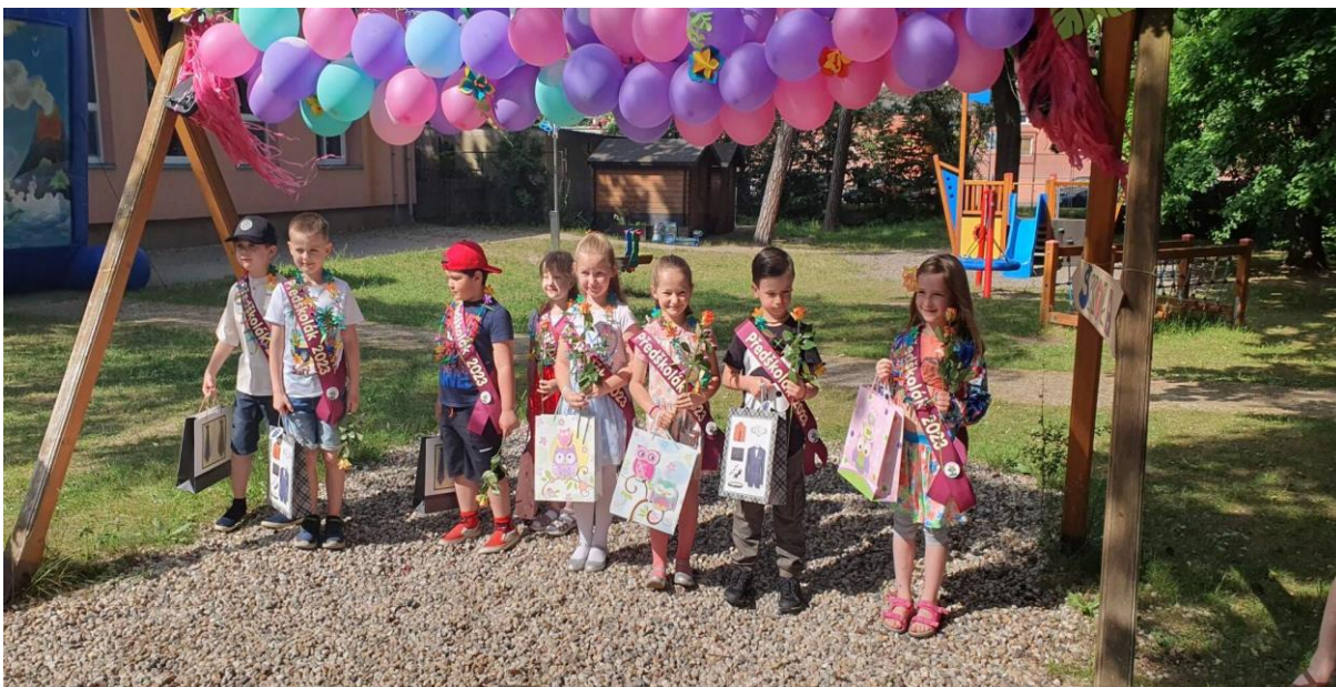
Rozloučení s předškoláky – MŠ Zahrádka