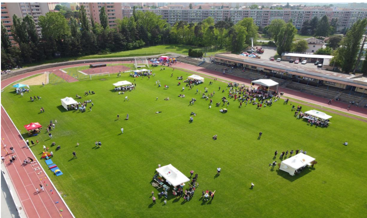
Akce „Harmonie slaví a všichni se baví“