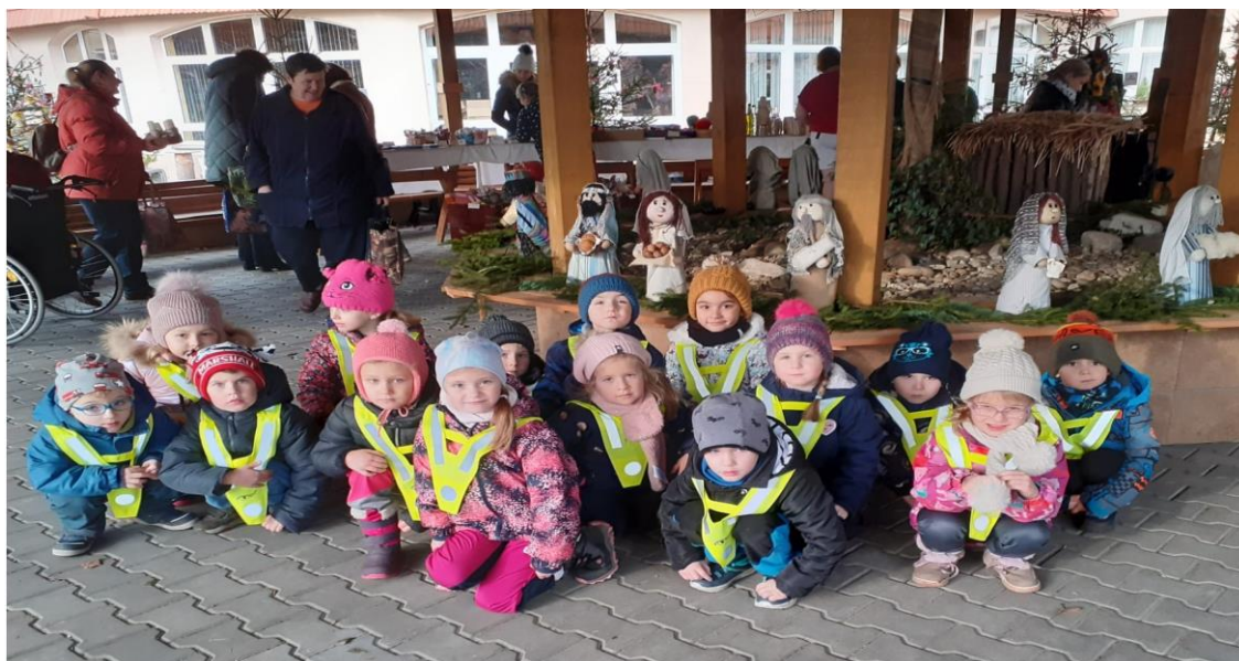
Zdobení stromečků v DKE

DŮM KNĚŽNY EMMY – děti z našich škol každý rok dochází do domu seniorů s připravenými vystoupeními k oslavě Vánoc, účastní se zdobení stromečků a zahájení Adventu, chodí blahopřát klientkám ke Dni matek.