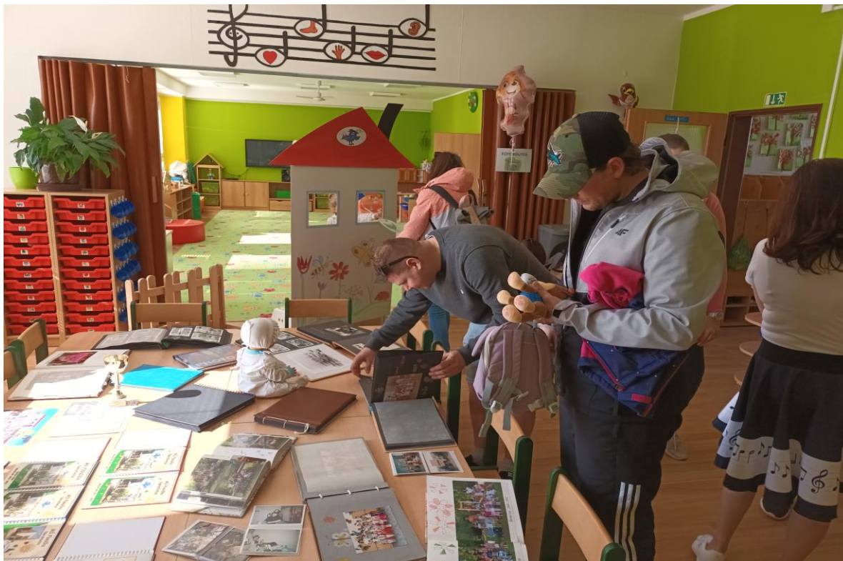
Den otevřených dveří – MŠ Pisnička

naší školní stravy, všichni byli zvědaví na občas neoblíbené pomazánky a myslím, že byli velmi mile překvapení tím, jak jsou chutné. Den otevřených dveří plánujeme organizovat každý rok.