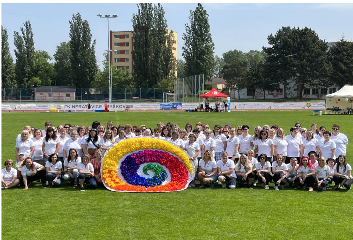
Oslavy 20 let vzniku školy – tým zaměstnanců mateřské školy Harmonie Neratovice