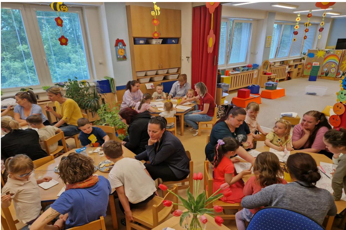
Slavíme Den matek – wellness pro maminky v MŠ U Rybiček