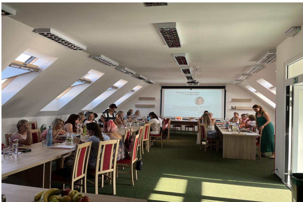
Dvoudenní seminář pro učitelky MŠ Harmonie – Pedagogická diagnostika v mateřské škole