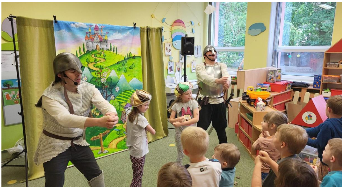
Divadlo ve školce