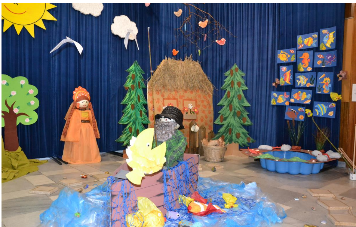
MŠ U Rybíček