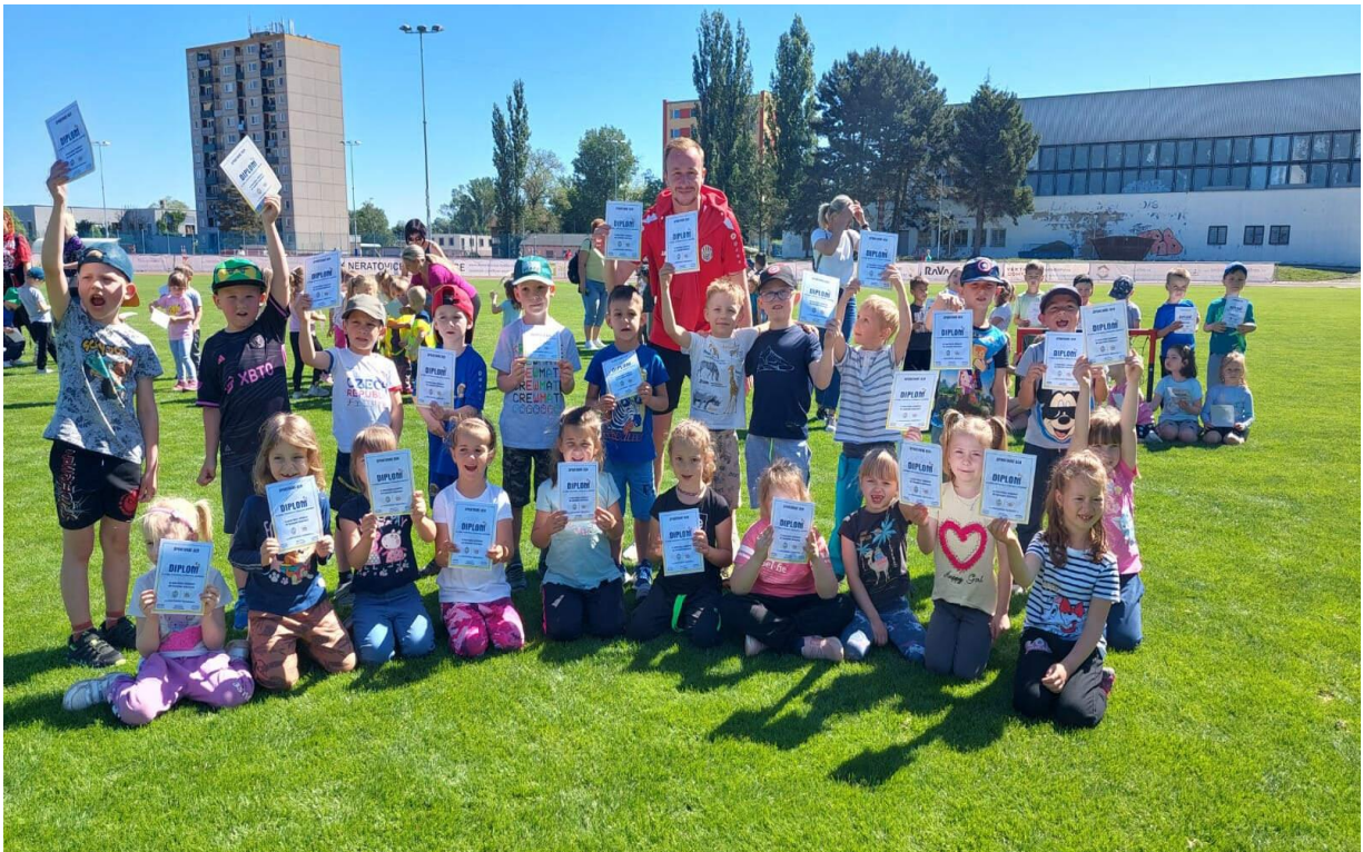
Sportovní dopoledne MŠ Harmonie Neratovice – 13.5.2024