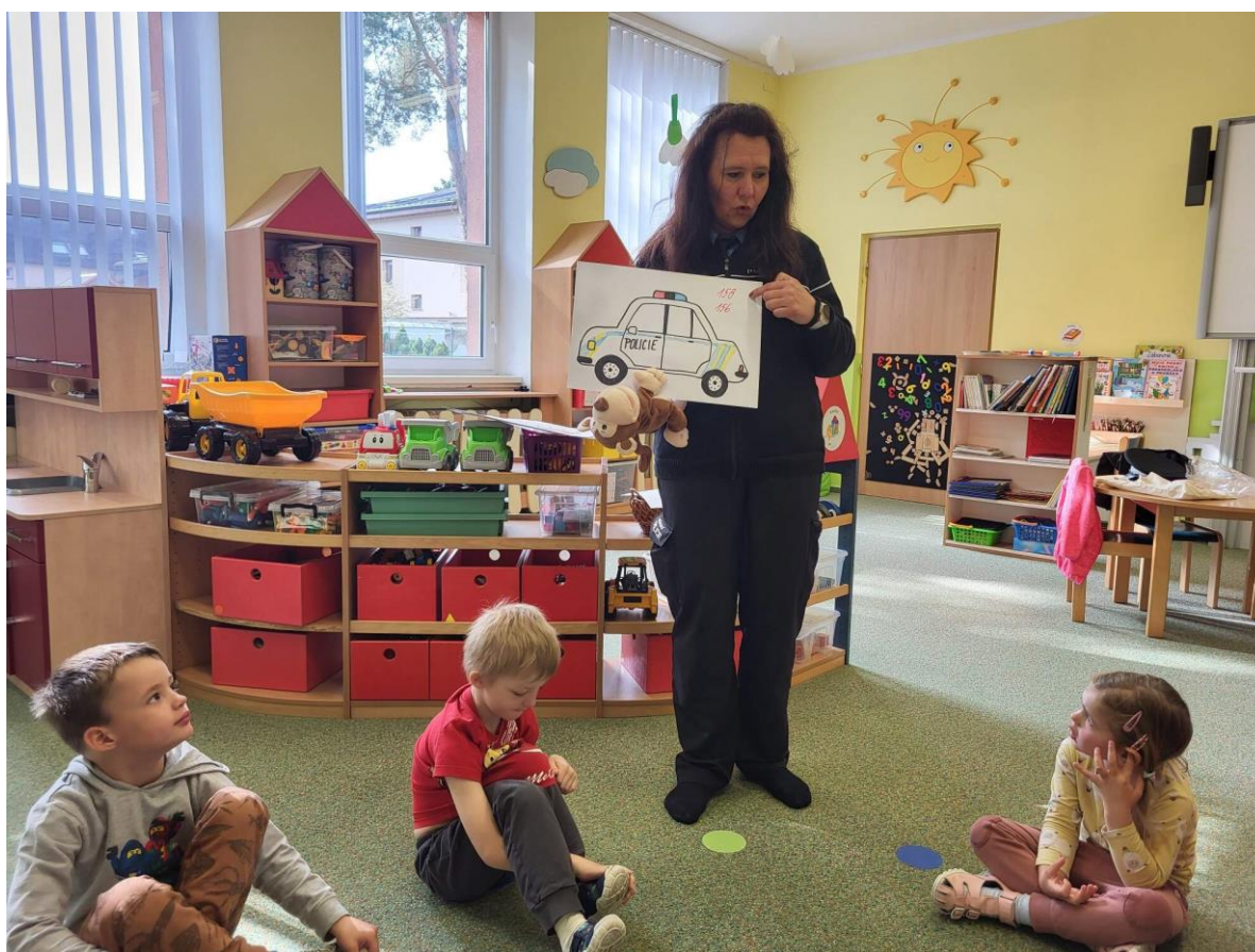
Beseda s PČR – MŠ Zahradka

Pro zajištění maximální možné bezpečnosti měkkých cílů/ našich dětí a pracovníků/ ze strany cizích osob jsou budovy velkých škol zajištěny proti neoprávněnému vstupu bezpečnostním systémem od firmy Comfis s.r.o. – Safy 2. Pro cizí osoby jsou budovy škol uzavřené a musí využít videofonu. Vchodové dveře všech pracovišť školy jsou opatřeny elektrozámkem a odchodovým tlačítkem ve výši 1,5 m. Tak je škola zajištěna před nechtěným odchodem dítěte z ní, a zároveň tím splňuje nařízení BOZP a PO, že vchodové dveře nesmí být uzamčeny. Během dopoledních vzdělávacích činností na zahradě školy se zamykají vstupní branky na pozemky škol.