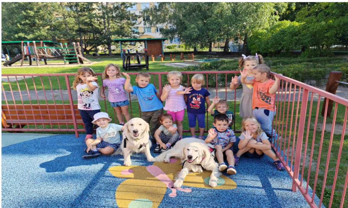
Projektový den s asistenčními psy