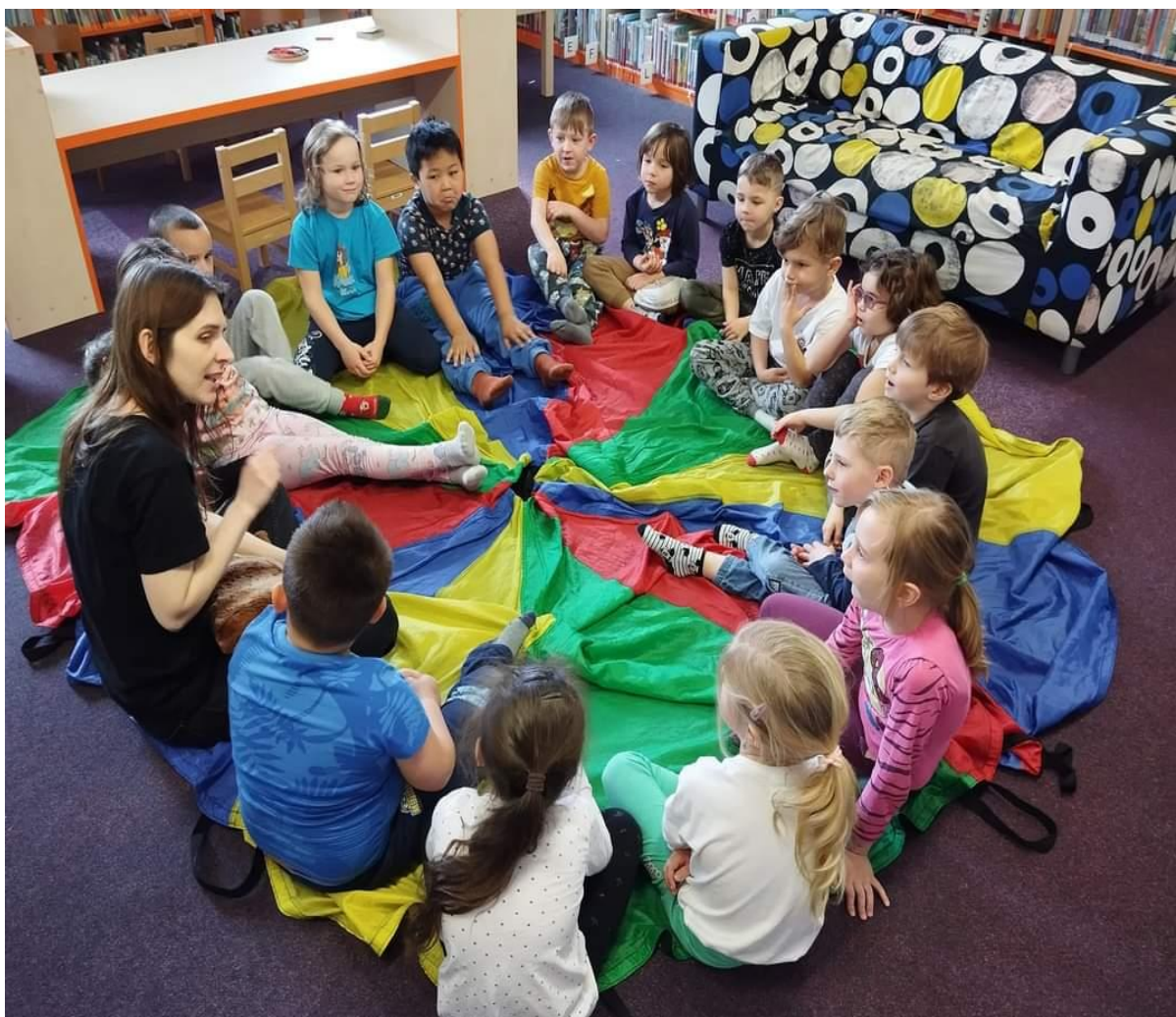
Předčtenářská příprava v knihovně – MŠ Čtyřlístek