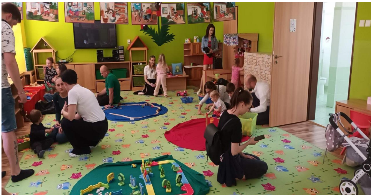
Den otevřených dveří – MŠ Písnicka

Po velmi kladné odezvě z loňského školního roku, jsme se rozhodli pravidelně pořádat Den otevřených dveří v naší škole. Letos proběhl v pátek 12.dubna od 13.00 – 16.00 na pracovištích v Neratovicích a v pátek 19. dubna na pracovišti v Mlékojedech. Tento termín jsme vybrali s ohledem na plánovaný zápis do mateřské školy. Zákonní zástupci tak měli společně s dětmi možnost navštívit všechna pracoviště, prohlédnout si vybavení škol, zahrady, a především se seznámit s pracovníci, které jim ochotně zodpověděly případné dotazy ohledně provozu, průběhu vzdělávání v naší škole, pedagogickém stylu, který je na daném pracovišti využíván. Všechny tyto informace mají usnadnit rodičům výběr pracoviště školy. Pro děti byly připravené hry, pohybové, výtvarné, hudební činnosti a pro každého malý dárek na památku. Velmi zajímavá byla i ochutnávka naší školní stravy, která všechny zúčastněné velmi mile překvapila svou chutností a pestrostí. Věřím, že i tímto způsobem se nám podařilo zbourat milné předsudky o pomazánkách v mateřské škole.