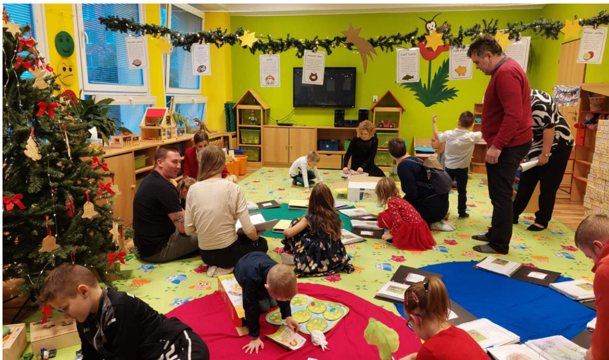
Vánoční čaj s rodiči – MŠ Písnicka