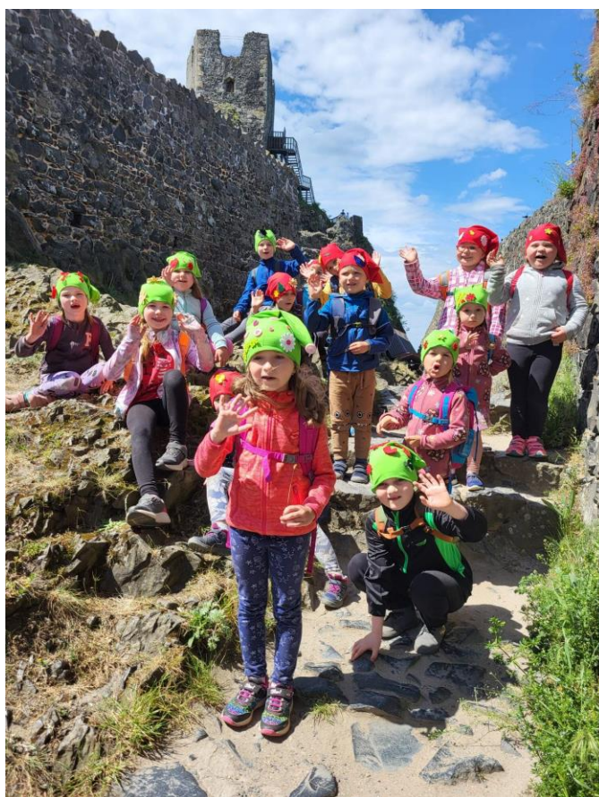
Škola v přírodě – Rovensko pod Troskami