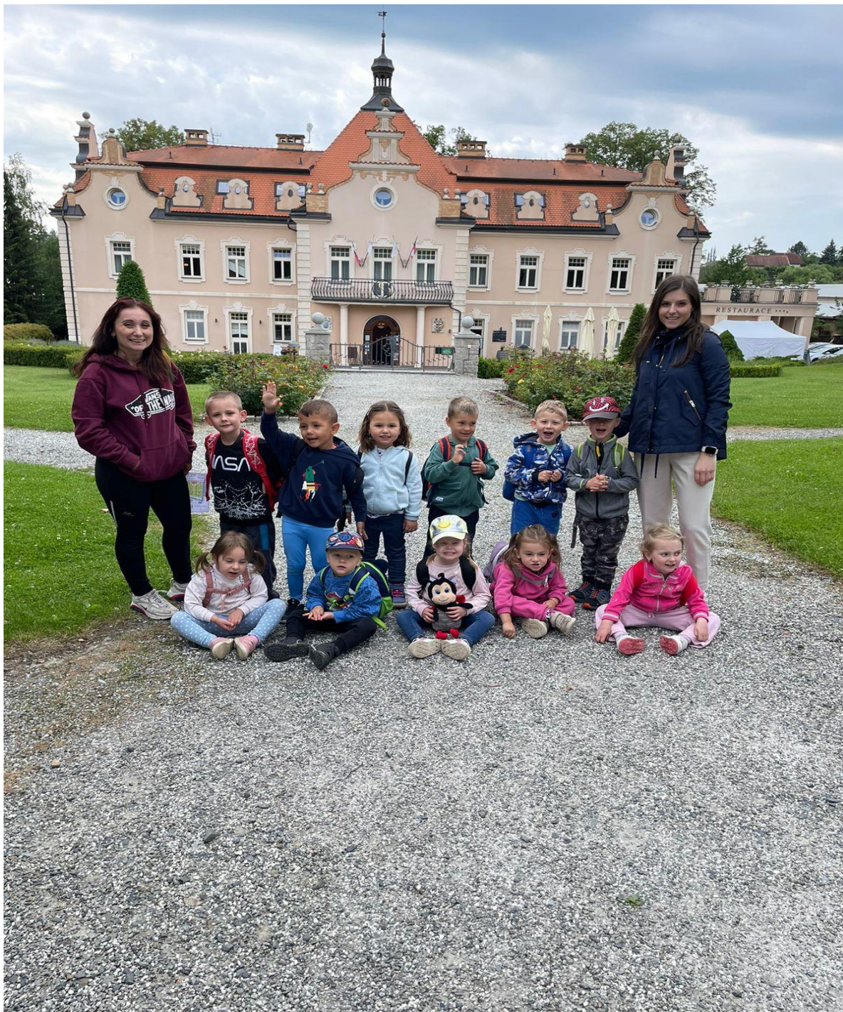
Výlet na zámek Berchtold