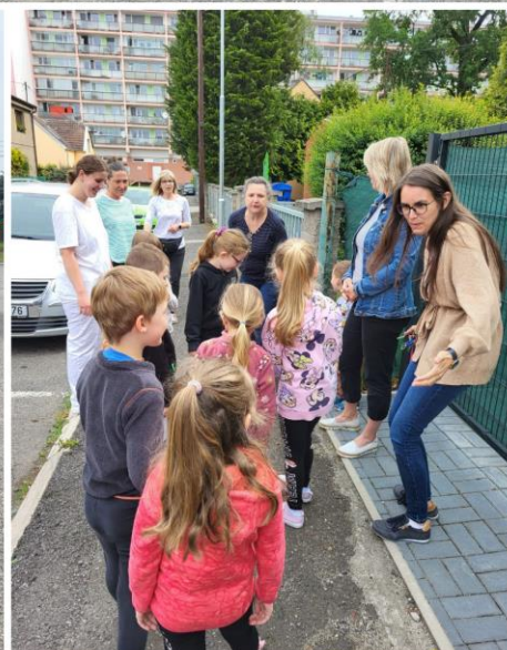
Cvičná evakuace 14.6.2024