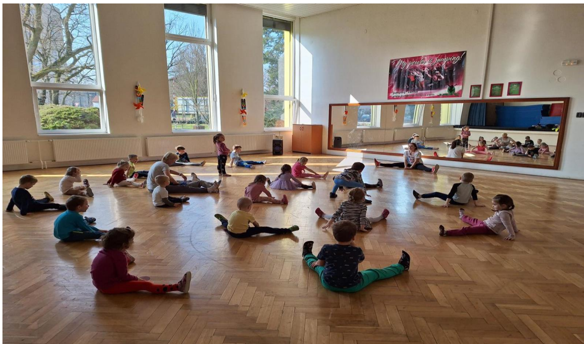
Cvičení v DDM