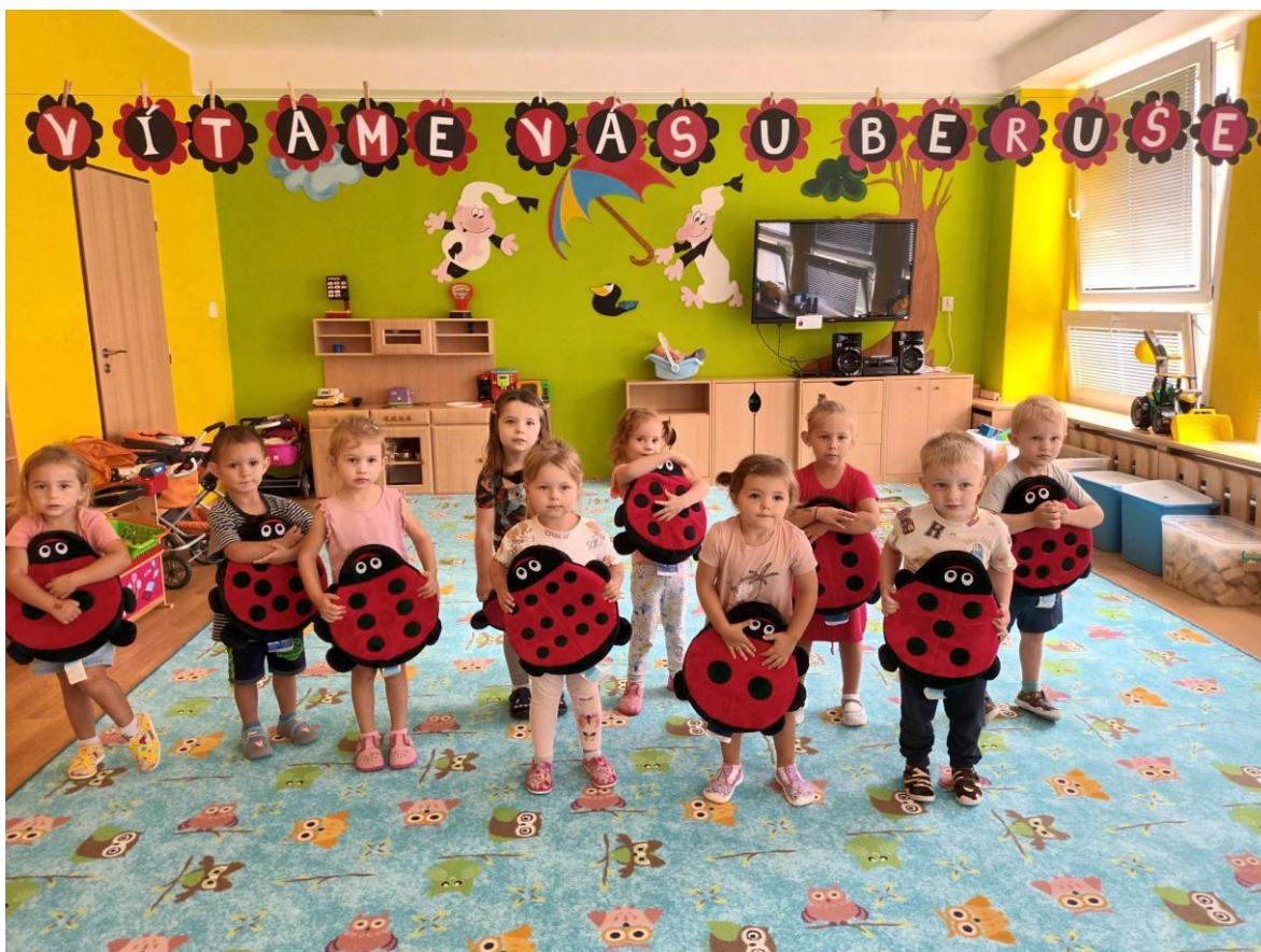
Adaptace nových dětí – MŠ Písnička