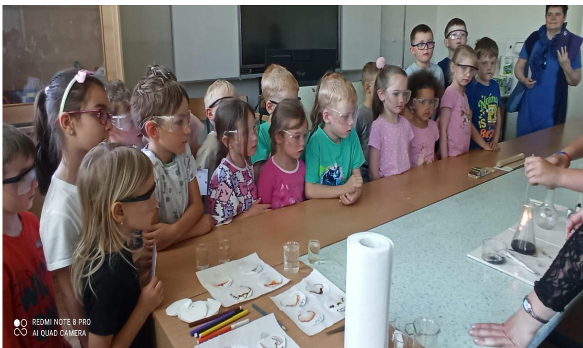
Hravé pokusy – návštěva ZŠ MPB