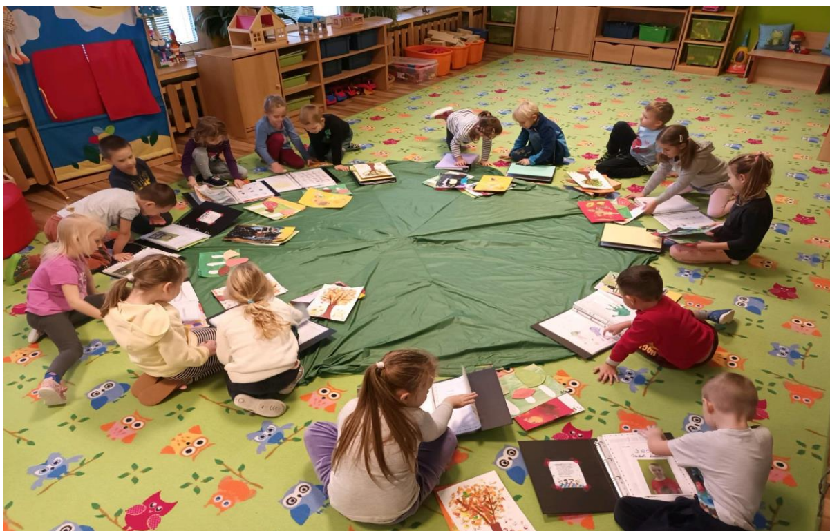
Vzdělávací činnosti dětí – práce s portfoliem – MŠ Písnička

U předškolních dětí kladou učitelky důraz na přípravu dětí pro vstup do ZŠ, tak aby děti nástup do ZŠ zvládly po všech stránkách a byly ve škole úspěšné. „Přípravu na školu“, zařazují učitelky do většiny činností každý den. Naše škola pravidelně vyhodnocuje průběh a výsledky vzdělávání. Učitelky dvakrát ročně zpracovávají hodnotící zprávy (pololetní a závěrečné hodnocení) jednotlivých třídních vzdělávacích plánů včetně vlastní sebereflexe.