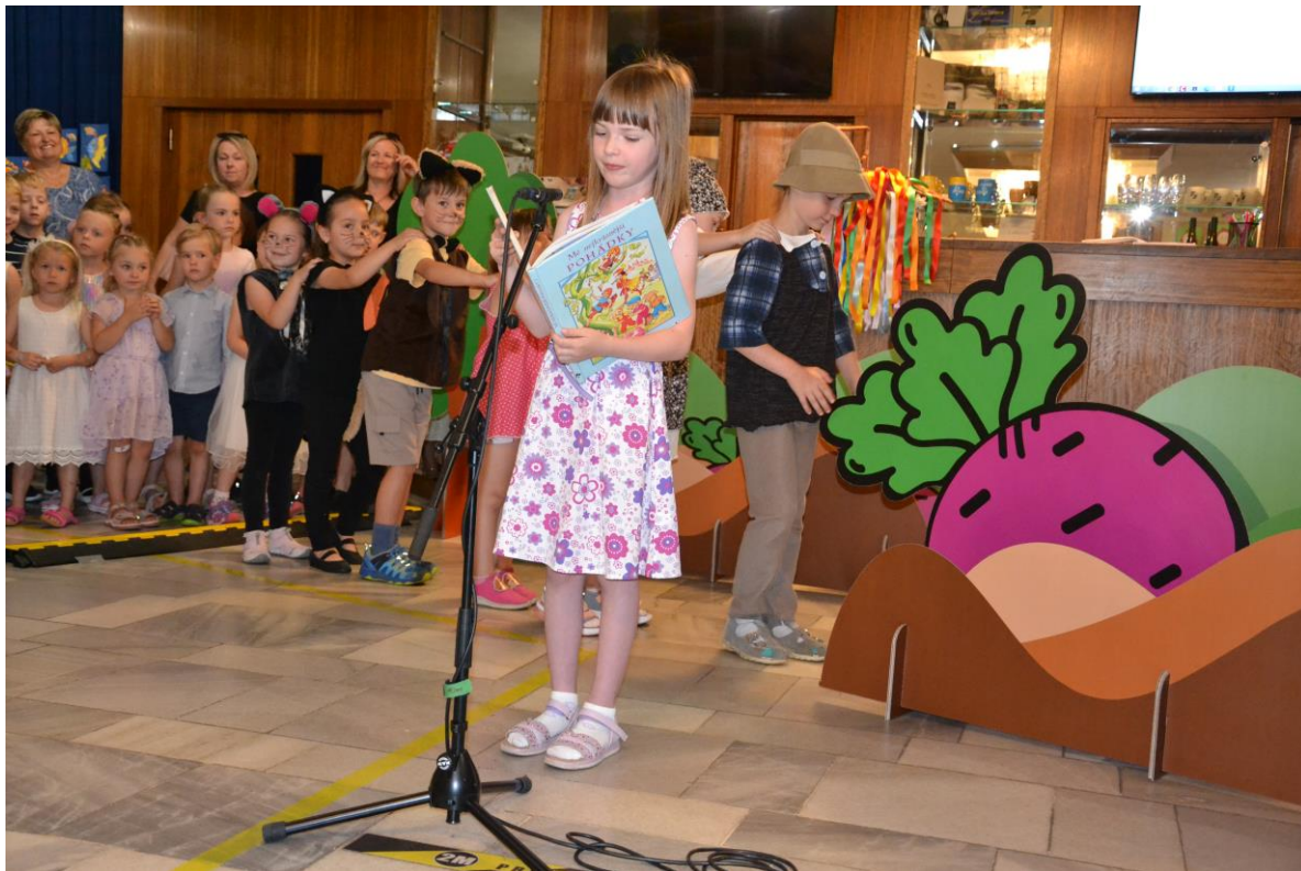
Slavnostní vernisáž 10.6.2024 k otevření výstavy „Se školkou do světa pohádek“