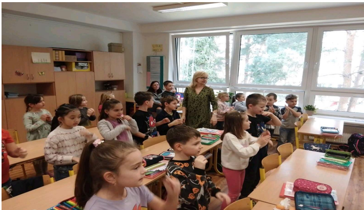
Návštěva v první třídě ZŠ MPB – MŠ Čtyřlístek