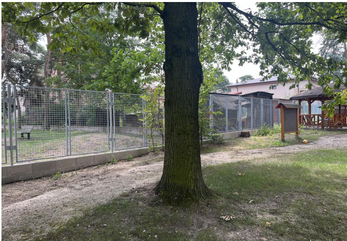
Nový plot – MŠ Zahrádka