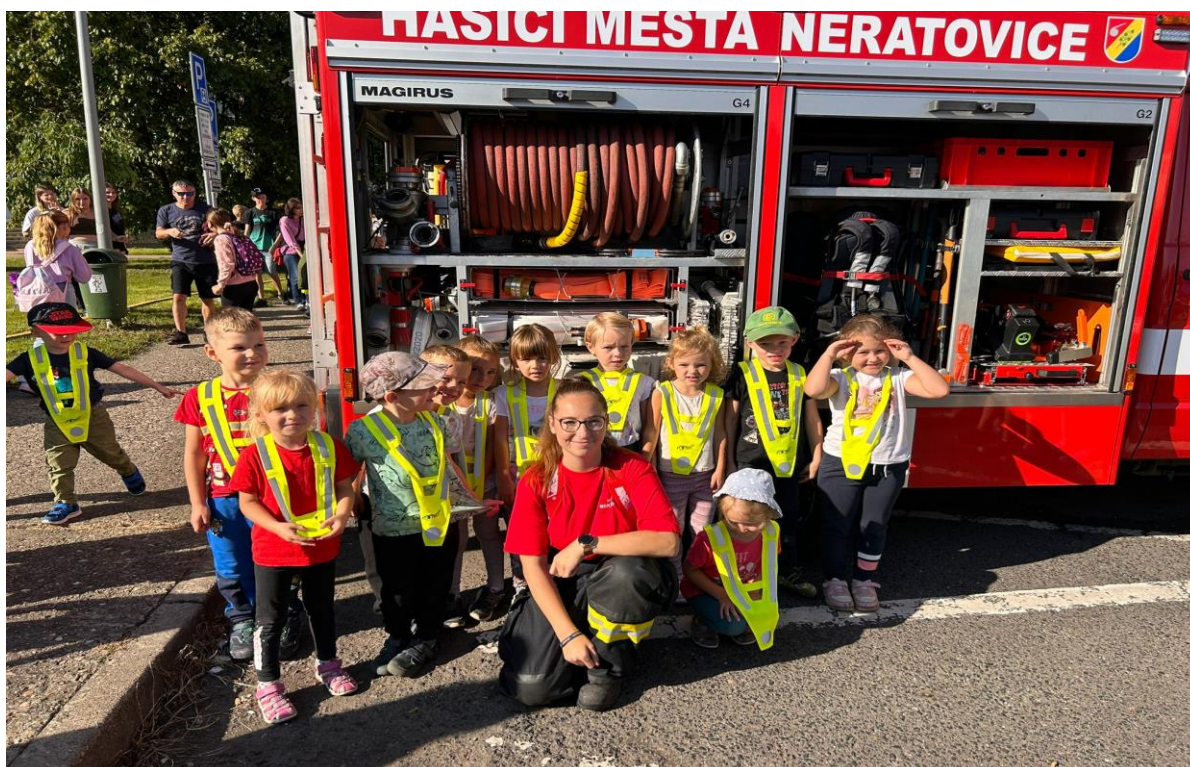
Děti z MŠ Sluníčko – Den bezpečí

V rámci prevence se snažíme často zařazovat úzce spjatá témata do týdenních plánů, aby děti věděly, jak konfliktní situace řešit a aby cítily zodpovědnost za své chování. Komunikační dovednosti jim pak pomohou řešit problémy. Ve skupině dětí mají opakující se možnost zlepšovat své sociální dovednosti a adekvátní reakce na neúspěch a stres.