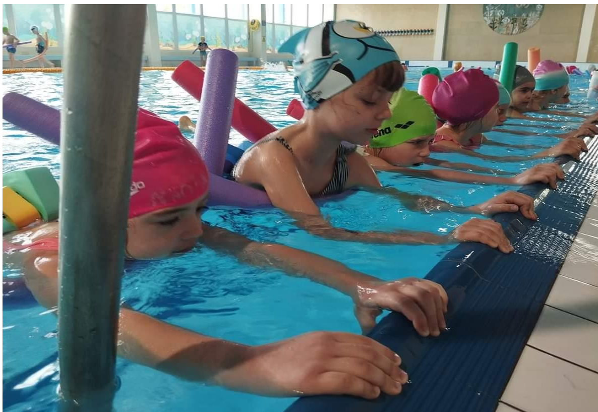
Předplavecký výcvik – MŠ Čtyřlístek