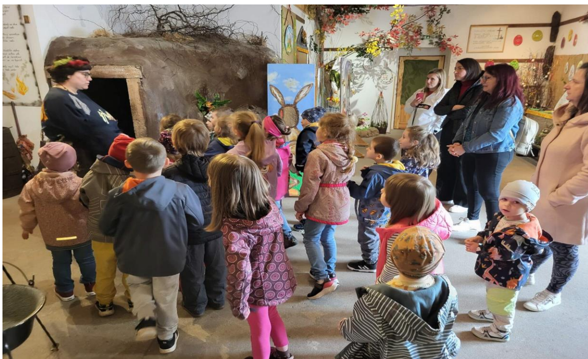
Výlet Čertova stodola