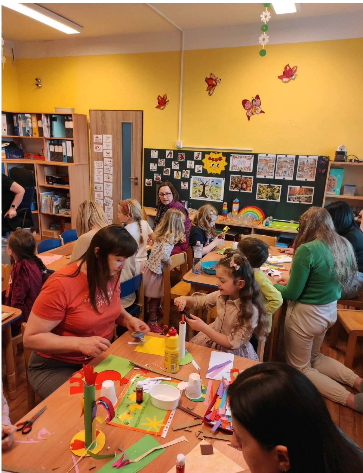
Velikonoční dílny s rodiči