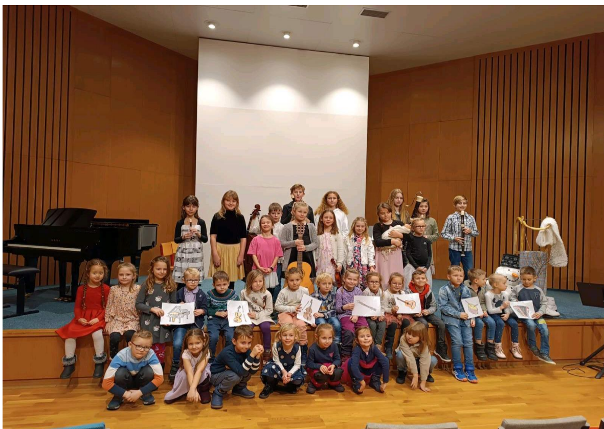
Nevýchovný koncert v ZÚŠ – MŠ Písnicka

ZÁKLADNÍ UMĚLECKÁ ŠKOLA – škola pro nás připravuje zkrácenou, nevyhovnou formu koncertu a interakcí našich dětí.