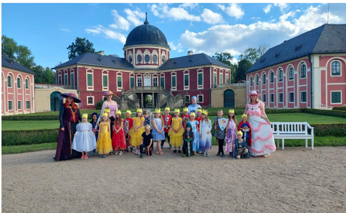
Škola v přírodě – zámek Veltrusy